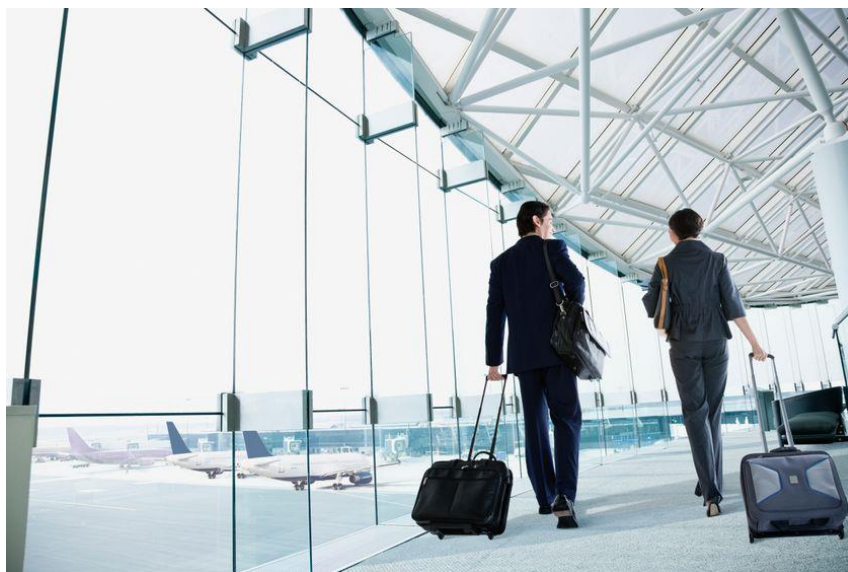
Two business travelers

L'activité du secteur a chuté de 70 % entre 2019 et 2020. Pourquoi ? Peut-elle retrouver son niveau d'avant-crise ?