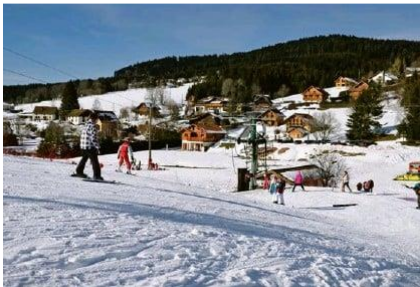
Grand Valtin (Vosges), plus petite station d'Europe, propose un forfait à 10 euros la journée.