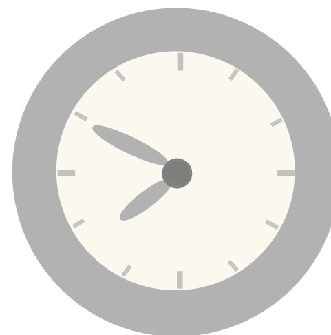
Son las ocho menos diez