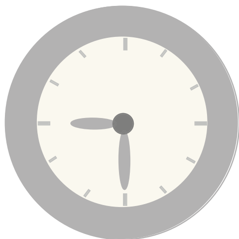
Son las nueve y media