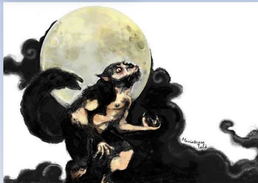
U Lup cumunal